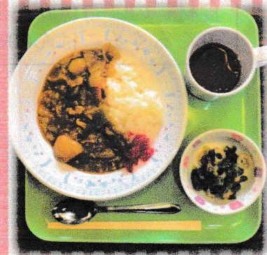
今までのごはんの内容

くるくるごはん804はいつでも寄付・食材・ボランティアを募集しています。右のHP等でご確認ください