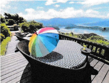
レインボーライン山頂公園