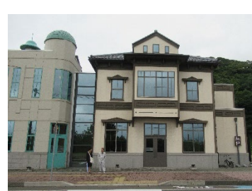
14時35分 「人道の港 敦賀ミュージウム」でポーランド孤児やユダヤ人への対応から敦賀の人々の優しさを学ぶ