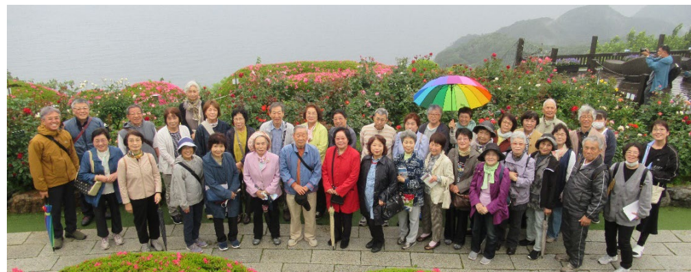
10時50分 満開のバラと雲にかすんだ若狭湾をバックに集合写真