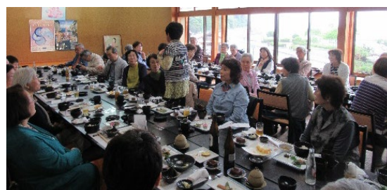
12時25分 小浜の「いけす割烹 雅」で昼食。女将より当地の“遊びまち”の歴史のうんちくも