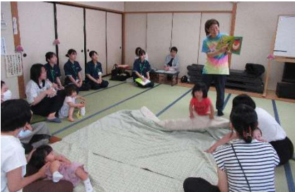
ニッキーズを見学する看護学生（黒色のポロシャツの人達）

6月18日（水）午前10時より、福井県立看護学校1年生4名が実習の一環として公民館を訪れました。目的は「地域で生活する人々を理解し、その人らしい生活を支えるため看護の基盤を養う」で、目標は「①地域に赴き、自分で見たり感じたりすることで地域の概要を知る。②地域で生活する人々と関わり、暮らしへの思いを知る」でした。最初に館長から日新地区と日新公民館の概要を聞いた後、ニッキーズと自主グループ「スティックリング」の活動を見学しました。