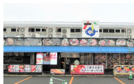
15時40分「日本海さかな街」でお土産購入！肉厚のホッケを買った人も

【参加者の感想】▼霧に包まれた五湖も風情があって良い物でした。皆さん元気があってよろしいですね。楽しい1日でした。▼土産付きで最高です。日新地区の人達と会えて、どこかで会ったときに挨拶できるといいと思います。▼心配していた天候もちょうどよく、暑すぎないで有難かったです。主事さんたちのお世話ぶりに感謝です。いろんな方とお話しできてとても楽しかったです。