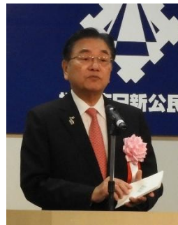
西行市長より祝辞