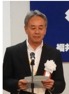
宇佐見実行委員長挨拶