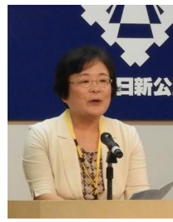
津田議員より祝辞